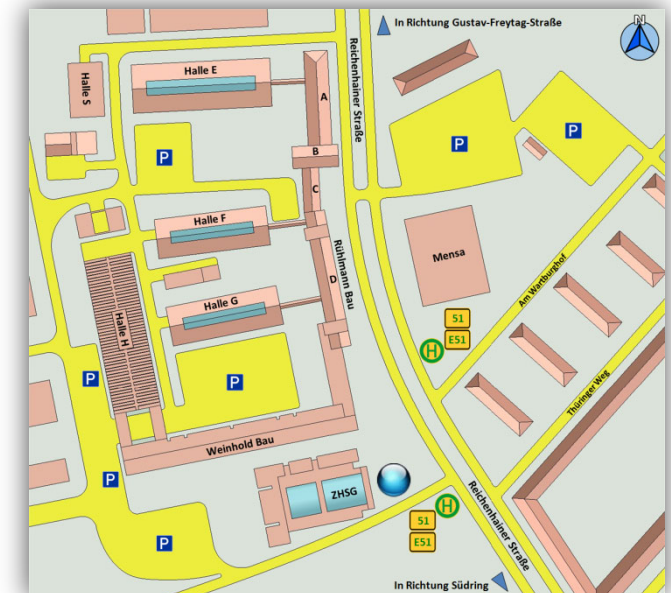
Campus der Technischen Universität in der Reichenhainer Straße, Veranstaltungsort Zentrales Hörsaal- und Seminargebäude