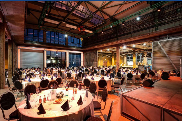
Kraftverkehr Event- und Kongresskultur in Chemnitz