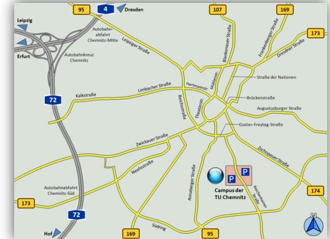
Stadtgebiet von Chemnitz, Autobahnen, Bundesstraßen, Campus der Technischen Universität

Technische Universität Chemnitz Zentrales Hörsaal- und Seminargebäude Reichenhainer Straße 90 09126 Chemnitz