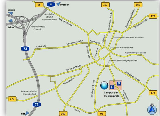
Stadtgebiet von Chemnitz, Autobahnen, Bundesstraßen, Campus der Technischen Universität

Technische Universität Chemnitz Zentrales Hörsaal- und Seminargebäude Reichenhainer Straße 90 09126 Chemnitz