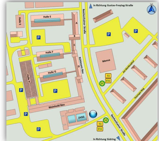
Campus der Technischen Universität in der Reichenhainer Straße, Veranstaltungsort Zentrales Hörsaal- und Seminargebäude