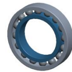
Abb. 4 Tabelle Lagerdaten