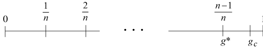
Abbildung 2: Limits und Gebote bei Auktionen

Bei den mechanischen Abläufen bestimmt das zweithöchste Limit den Zuschlagspreis, für den der stärkste Bieter das Gut erhält. Damit ist die Effizienz gewährleistet. In einem stochastischen Umfeld ist dies aber keineswegs garantiert. Wenn der zahlungswilligste Nachfrager gegen ein akzidentielles Gebot verliert, gilt das „Revenue Equivalence Theorem“ nicht. Somit reflektieren die Holländische Auktion und die Einschreibung offenbar Marktmacht, da sie dem organisierenden Verkäufer meistens eine höhere Einnahme gegenüber der Englischen und der Vickrey-Auktion bescheren.